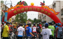
▲ 佛冈自行车赛中准备中